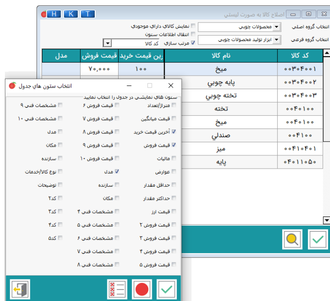
تصویر شماره ۴