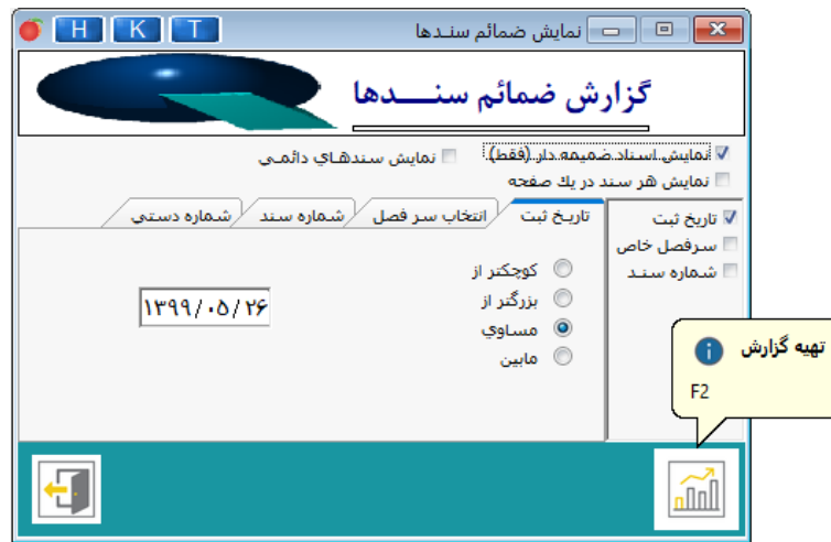
تصویر شماره ۲