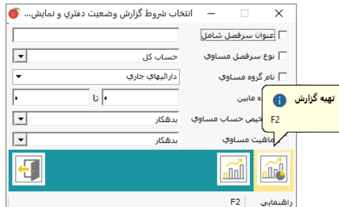
تصویر شماره ۳