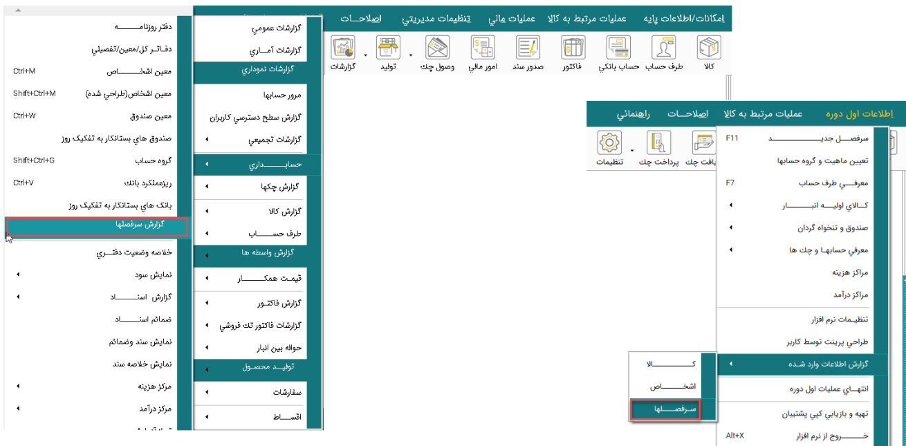
تصویر شماره ۱