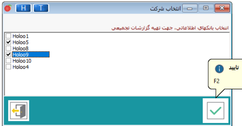
تصویر شماره ۲