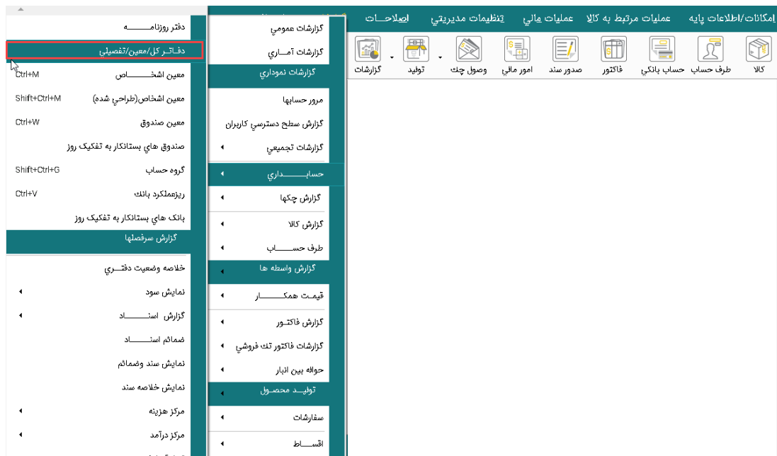
تصویر شماره ۱