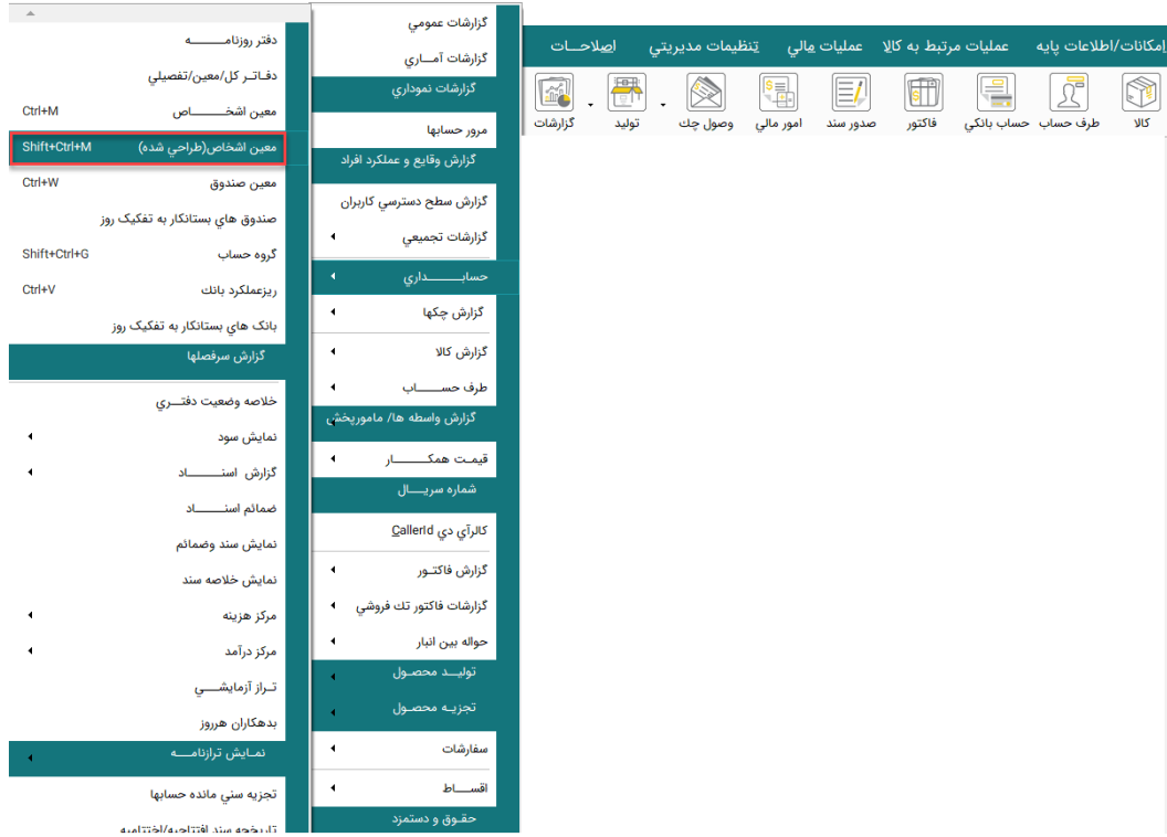
تصویر شماره ۱

گزارشات ← حسابداری ← معین اشخاص (طراحی شده)