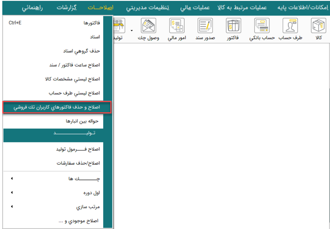
تصویر شماره ۱