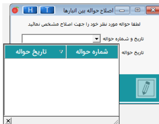
تصویر شماره ۲